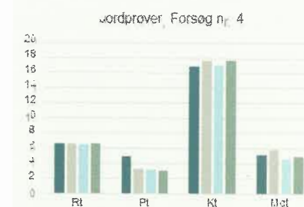
Figur 3. Jordprøver for gødsning. Forsøg nr. 4, 4 led. NuthY landsforsøg 2018.

I figur 3 har vi samlet analyseresultaterne fra alle fire led i et enkelt forsøg. Det er ganske ensartede resultater, dog med en vis variation i Pt og Kt. Konsekvensen af de meget høje kalital i det aktuelle forsøg, kan muligvis genfindes i den meget lave Mg-bladanalyse.